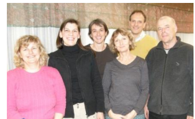
Ihr Leitungsteam Dorf-Treff

Übrigens, gerne nehmen wir auch Programmwünsche entgegen. Senden Sie uns dazu ein Mail an treff@forum-samstagn.ch