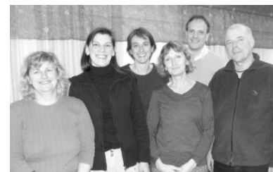
Ihr Leitungsteam Dorf-Treff

Wir würden uns freuen, wenn Sie an eine nächste Veranstaltung kommen, den Dorf-Treff selber mieten oder sogar im Dorf-Treff mithelfen wollen.